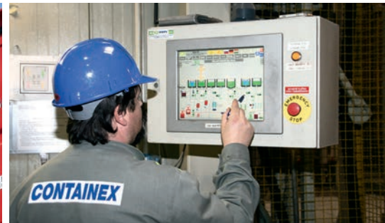
Haut niveau d'automatisation de la production