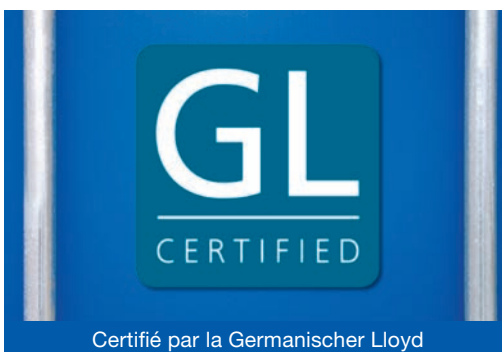
Certifié par la Germanischer Lloyd