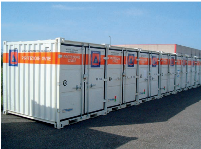
Conteneurs de stockage en cas de catastrophe