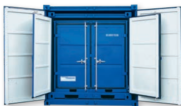
Exemple de set (LC 10' + 8' + 6')