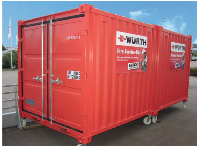
Conteneurs de stockage comme support de publicité