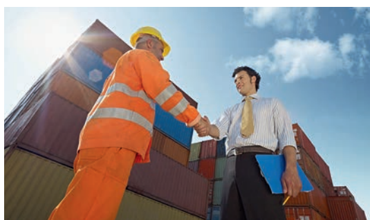
Dépôt de conteneurs