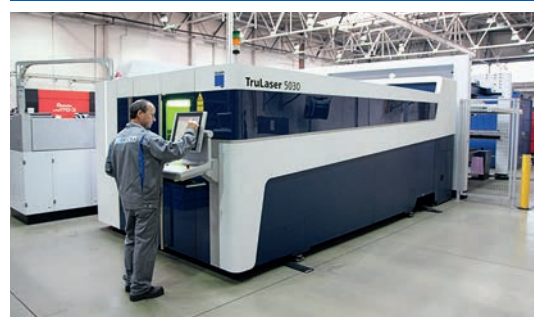
Machine de découpe au laser