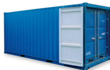
Exemple de set (LC 20' + LC 8' + LC 8')