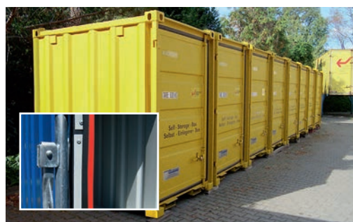
Mover-Box avec bandes anti-feu