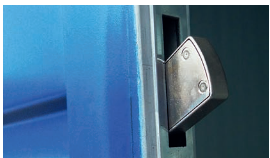
Serrure de verrouillage interne