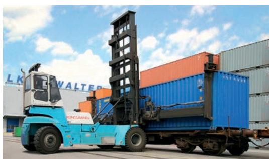
Chargement des conteneurs sur train