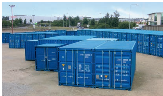
Dépôt de self-stockage