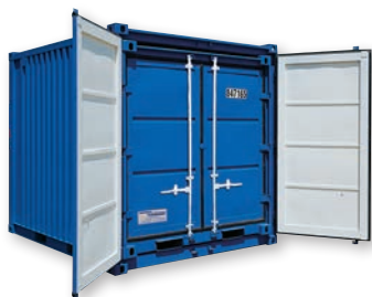
Exemple de set (LC 10' + 8')