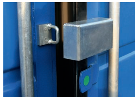
Protection cadenas montée