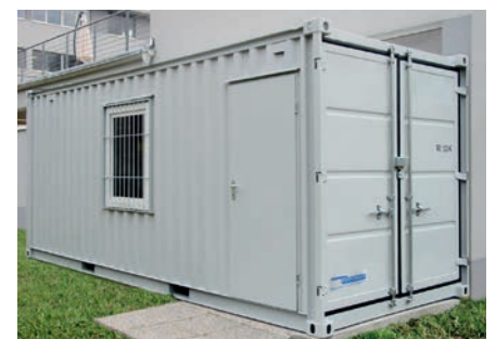
LC 20' avec fenêtre et porte piéton