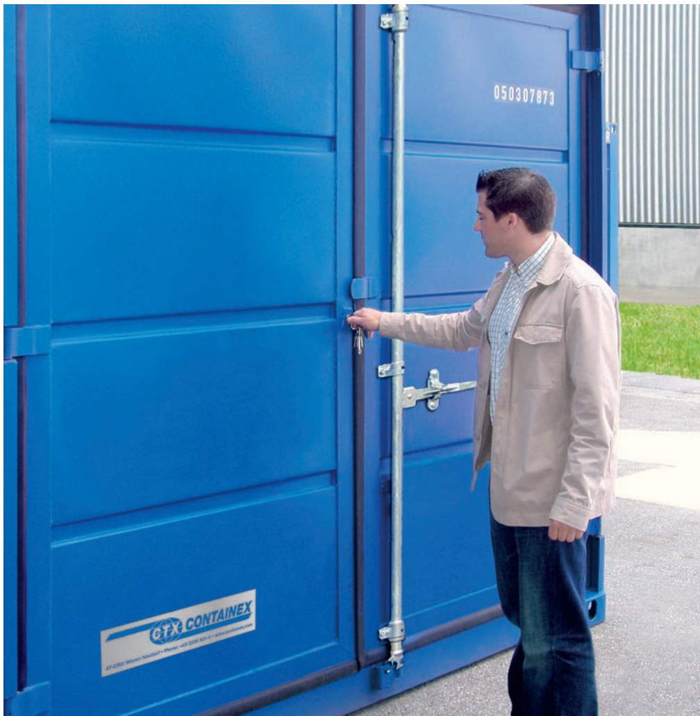
Conteneurs de stockage avec kit de sécurité