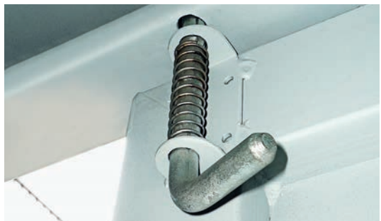
2 loquets internes de fermeture