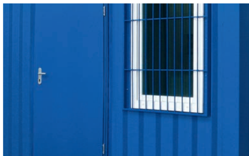
Fenêtre et porte piéton*