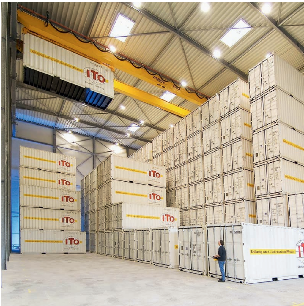
Utilisation optimale de l'espace dans le hangar de stockage