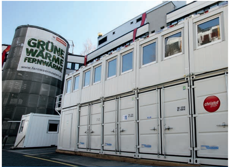
Stockage et bureau