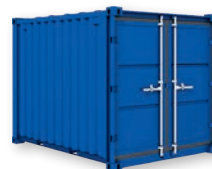
Modèle LC 9'