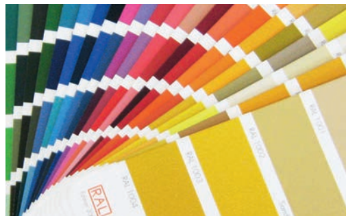
Couleurs selon la carte RAL-CTX