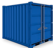
Modèle LC 8'