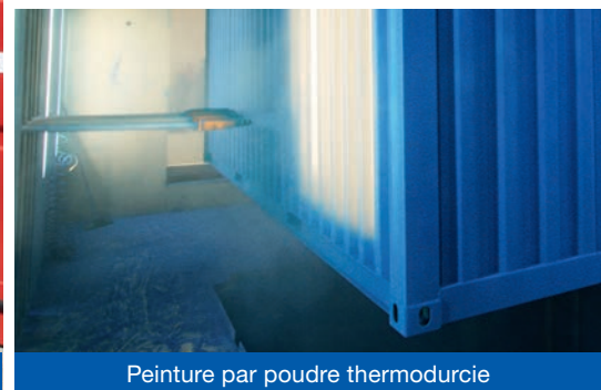
Peinture par poudre thermodurcie