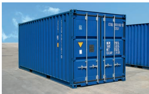
Conteneur maritime 20'