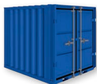
Modèle LC 6'