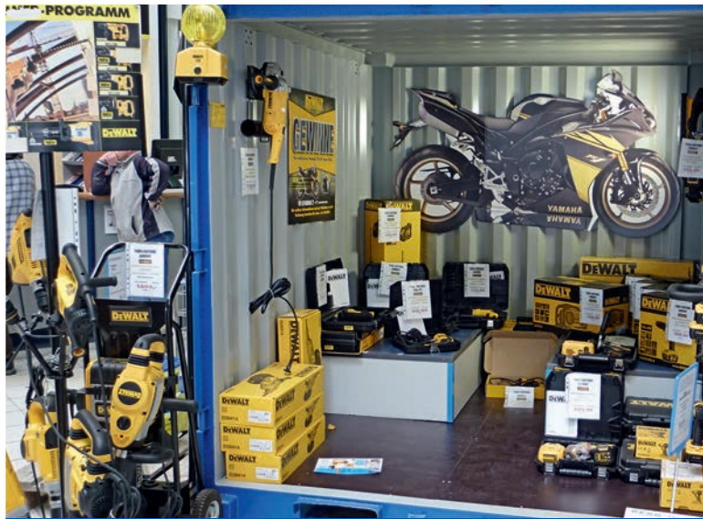
Conteneurs de stockage comme stand de salon