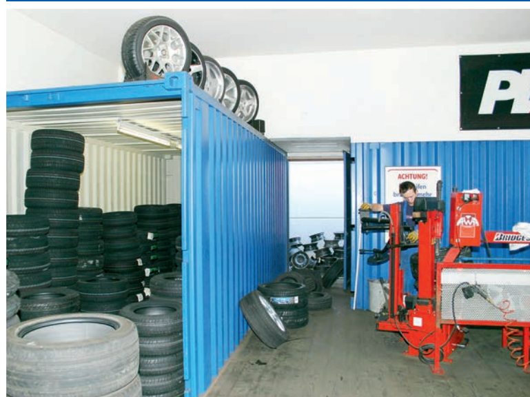
Stockage de pneus au garage