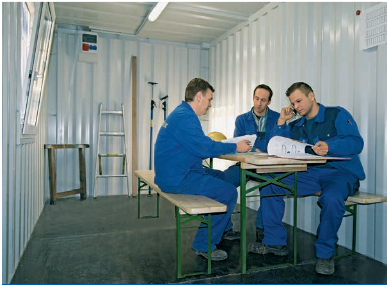
Salle de repos sur un chantier