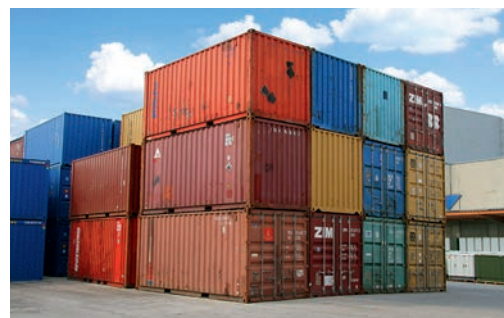
Conteneurs maritimes d'occasion