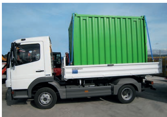
Transport sur camion