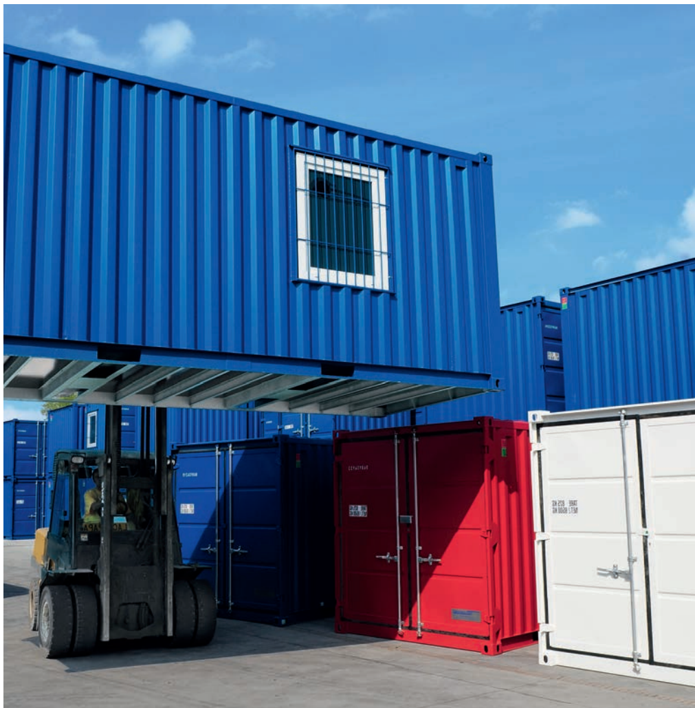
Les conteneurs de stockage CTX sont disponibles en différentes tailles et avec différents équipements