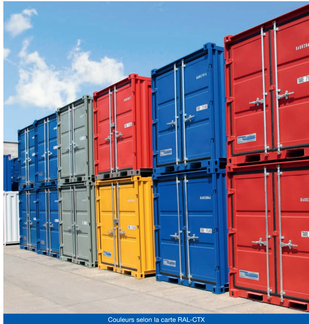
Couleurs selon la carte RAL-CTX