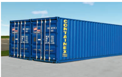
Conteneur maritime 40'