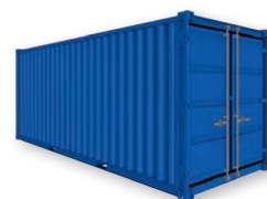
Modèle LC 20'