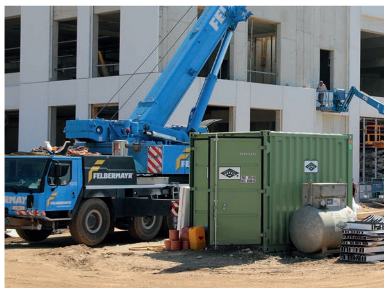
Utilisation sur chantier