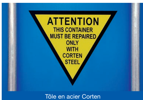
Tôle en acier Corten