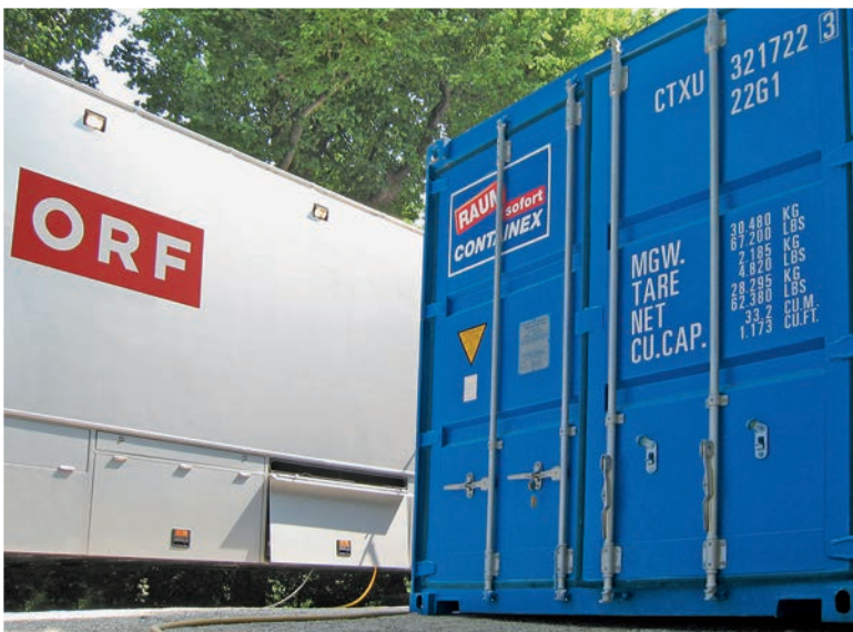
Stockage d'équipements lors de manifestations