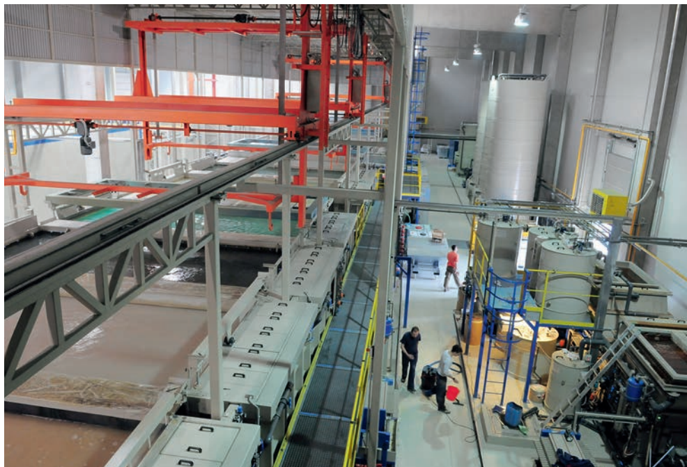
Chaîne de peinture KTL