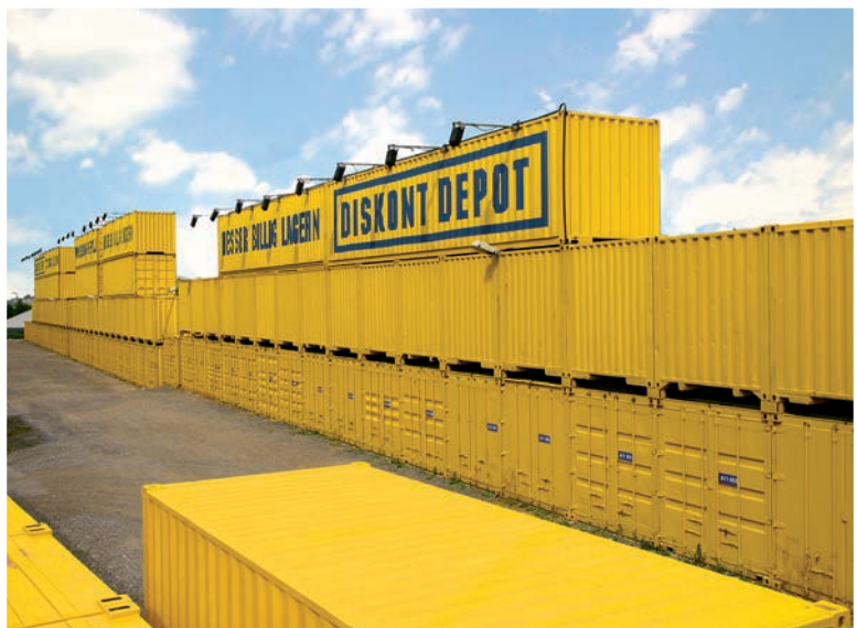
Depôt de self storage