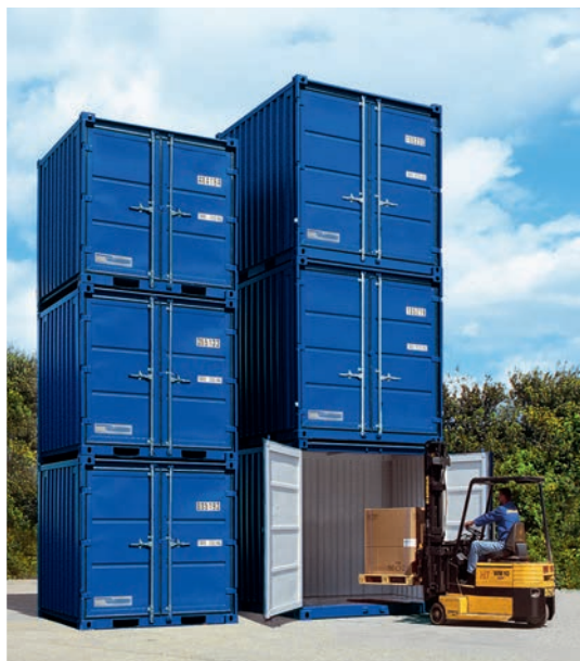
Superposable sur 3 niveaux