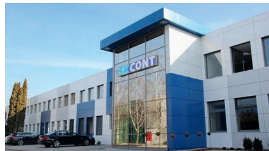
Usine de production à Komarno (SK)