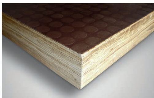
Plancher en bambou avec revêtement anti-dérapant