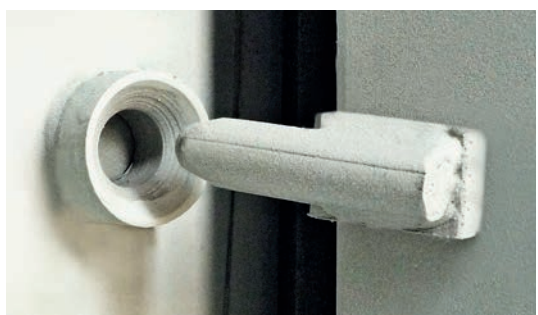
4 protections anti-décrochage de porte