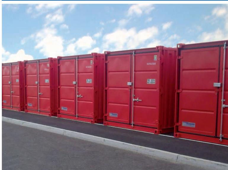
Stockage de matériel en entreprise